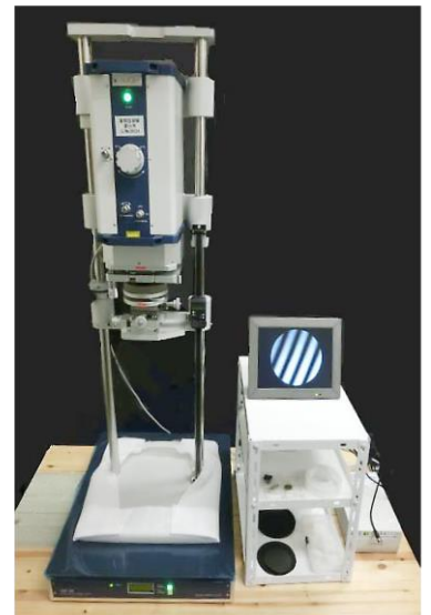
干渉計を搭載したSAT-56